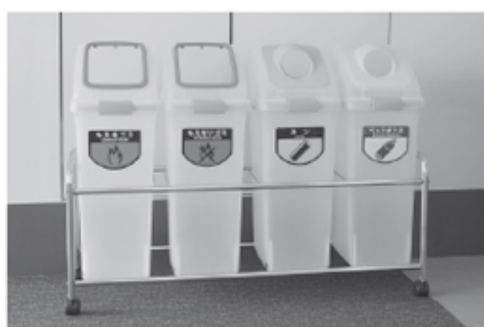
空き缶・ビン・ペットボトルの分別に『リサイクルトラッシュ』