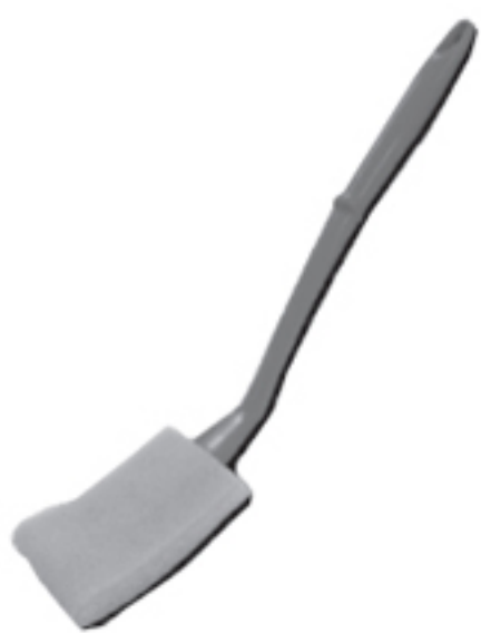
キズノン柄付きクリーナー

トイレの陶器に傷をつけずに汚れをしっかりと落とす「キズノン目皿ポットクリナー」が好評のキクロン株式会社から同じ素材のトイレ洗浄用スポンジが発売されました。商品名は「キズノン柄付きクリーナー」です。