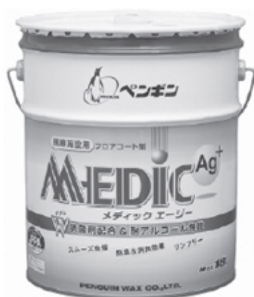
メディックエージー

これらの製品性能を備えた製品が従来製品「メディック」がさらに進化した「メディックエージー」です。