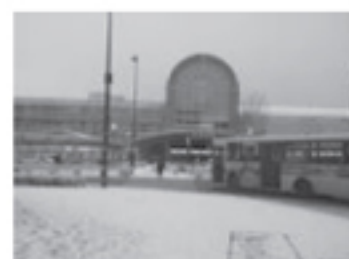
マンションのエントランス 毎年、雪でお困りの現場