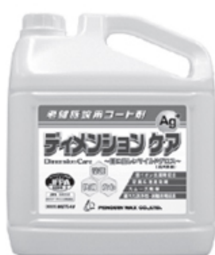
ディメンションケア