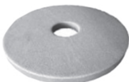
ブラッシュパッド「トレピカ」

13インチ 1枚 15インチ 1枚 17インチ 1枚 パッドホルダー用 1枚 ハンド用(5枚入) 1枚 ブラッシュパッド「ホワイト」 13インチ 1枚 15インチ 1枚 17インチ 1枚 パッドホルダー用 1枚 ハンド用(5枚入) 1枚