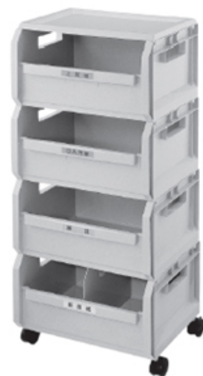
紙類の分別に『エコボックス』

装栄では紙類その他ごみの分別に必要な機材を取り揃えております。分別に関しては装栄担当者に御相談下さい。